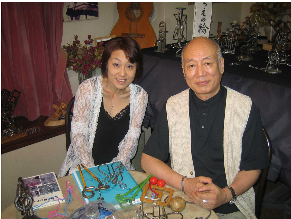
知恵の輪は年齢の差がなく誰もが楽しめます・・・知恵の輪で右脳を活性化&健康に！？