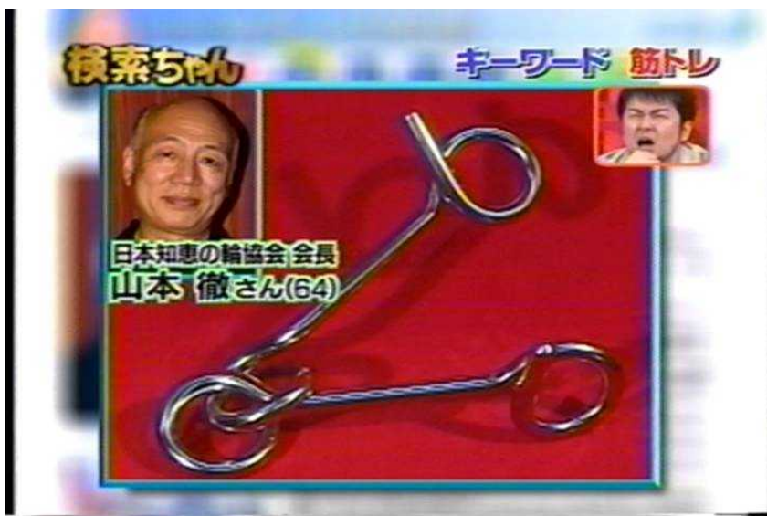
答えは知恵の輪名人考案の「ダンベルの知恵の輪」でした