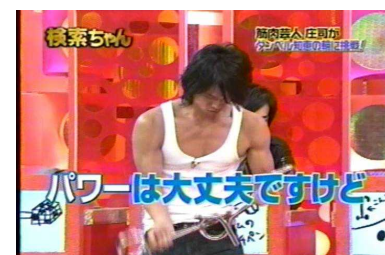
早速庄次君がトライしました