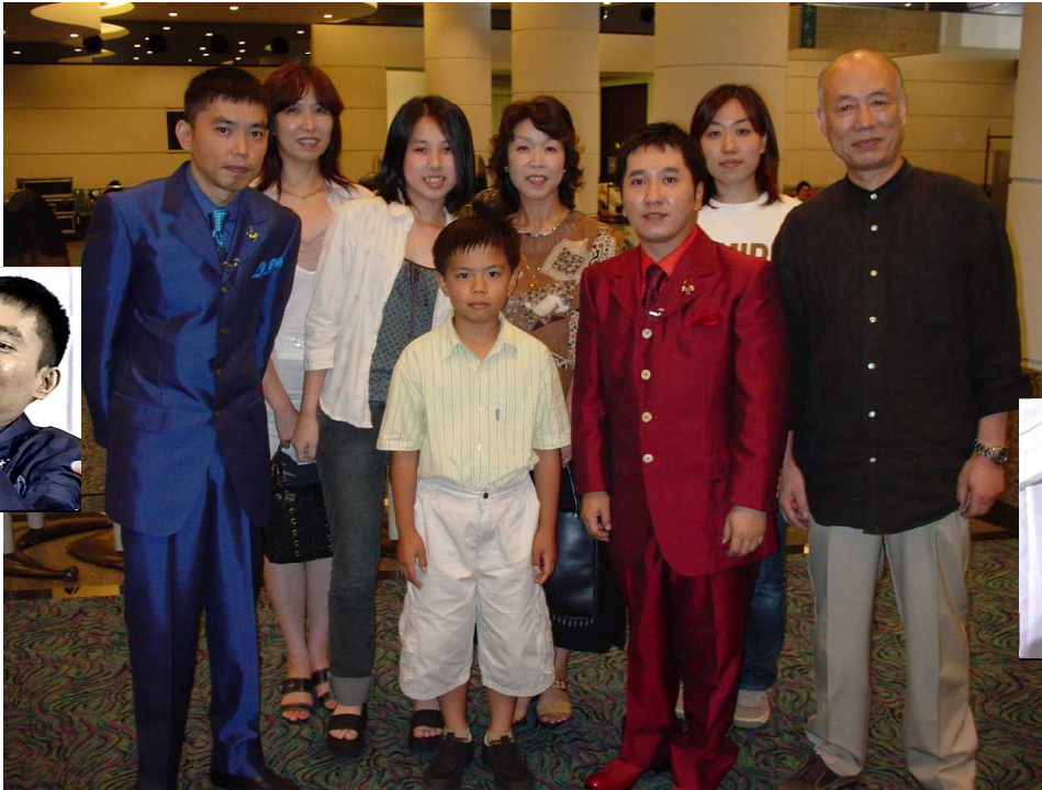
問題に知恵の輪の鍵をつきました？