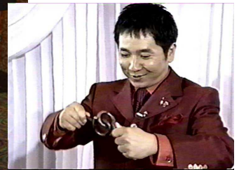
爆笑問題 田中裕二