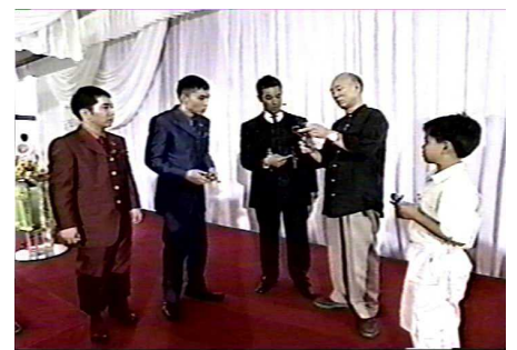
易しい問題と難しい問題の二種類あり易しい問題には三つの知恵の輪の鍵が？